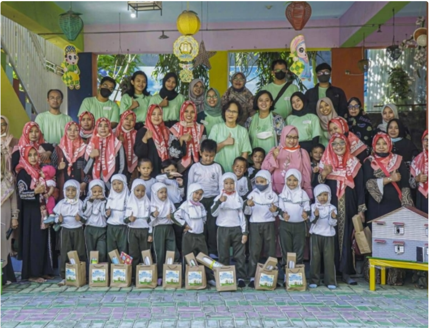
Tim KKN Tematik ITS berfoto bersama para orang tua, guru, dan siswa TK Muslimat NU 292 Istiqlaliyah usai kegiatan edukasi rumah sehat

GRESIK – Edukasi mengenai rumah sehat belum sepenuhnya menjangkau anak usia dini. Kondisi ini kemudian menggerakkan tim Kuliah Kerja Nyata (KKN) Tematik Institut Teknologi Sepuluh Nopember (ITS) untuk memperkenalkan fitur rumah sehat dan konsep Perilaku Hidup Bersih dan Sehat (PHBS) lewat